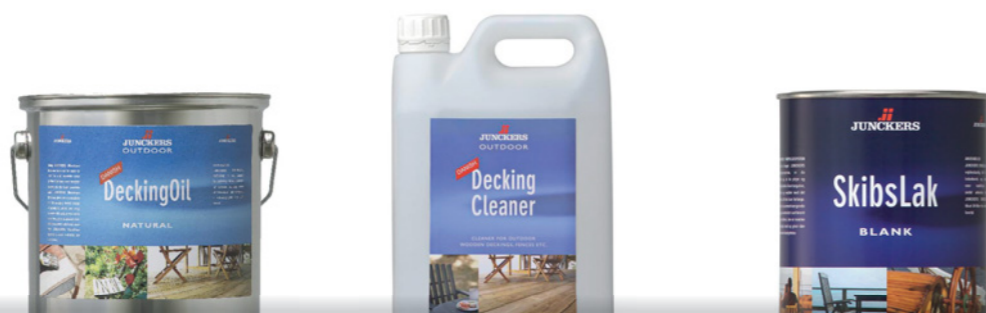
JUNCKERS DECKING OIL