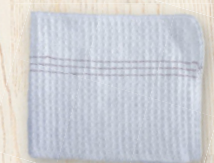
bavlněný hadr na stírání oleje