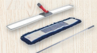
mopy pro velkoplošnou údržbu